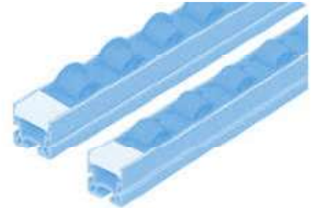
Distanzstück L25 für Rollenkäfig AL Spacer L25 for Roller Cage AL